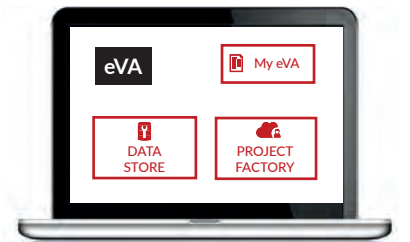
eVA, un outil inédit partenaire de la productivité des ingénieurs de l'automobile

► Plus d'infos : www.adaccess.online/plateforme-eva